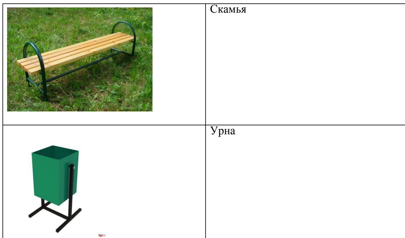
Таблица 1.Примерный перечень элементов благоустройства

Дополнительный перечень видов работ по благоустройству дворовых территорий предполагает: